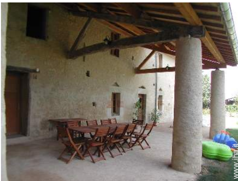
tavolo da giardino