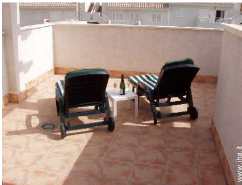
terrazzo sul tetto