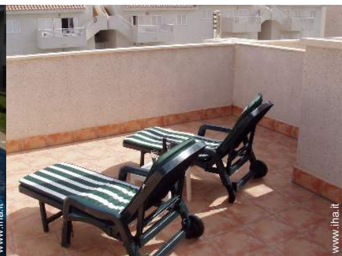
terrazzo sul tetto