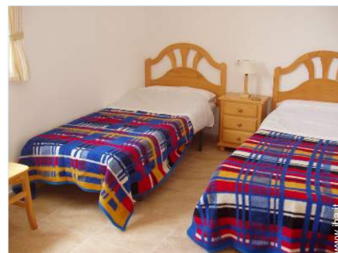
stanza degli ospiti

Tavolo da giardino, sedia(e) da giardino, ombrellone