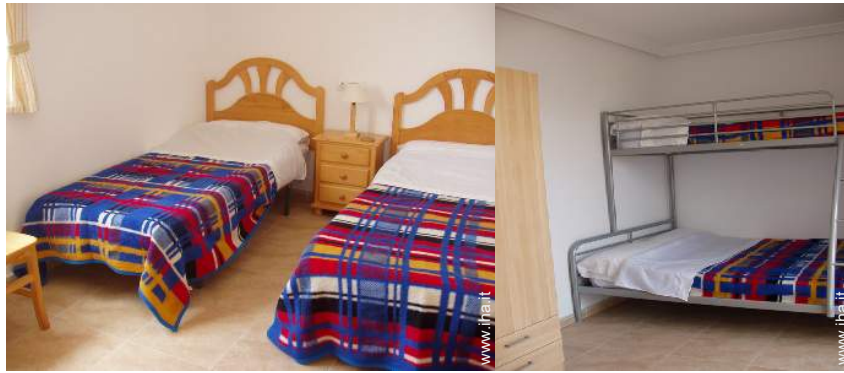
stanza degli ospiti