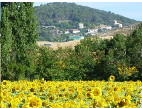
vista sul villaggio