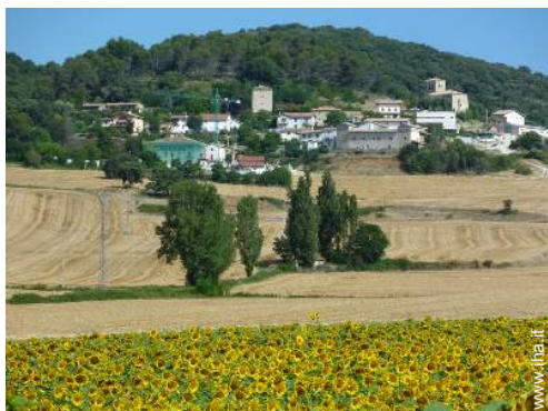
vista sul villaggio