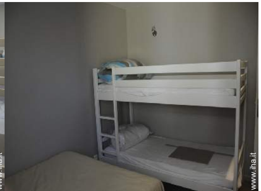
letti a castello