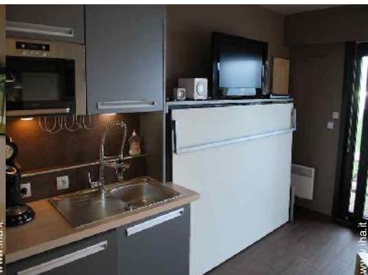
letto(i) a scomparsa 2 pers