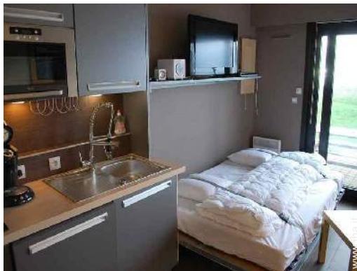
letto(i) a scomparsa 2 pers