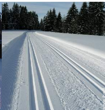
sport invernali nelle vicinanze