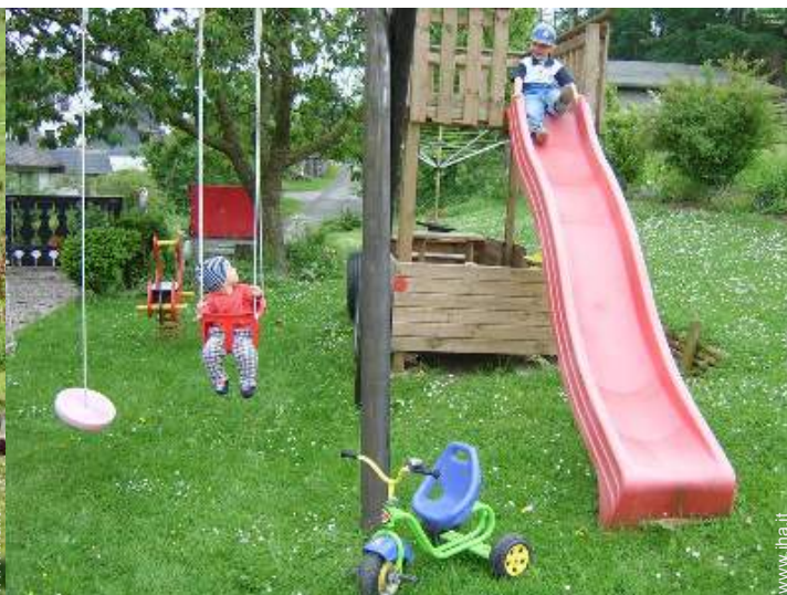
vasca per la sabbia