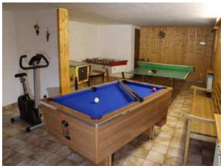
tavolo da biliardo