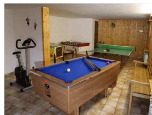
tavolo da biliardo