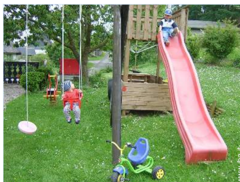
vasca per la sabbia