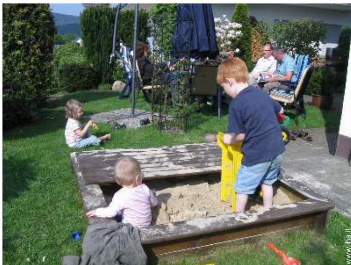
vasca per la sabbia