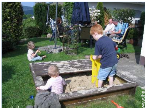
vasca per la sabbia