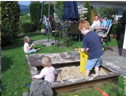
vasca per la sabbia