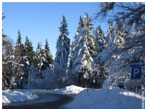
sport invernali nelle vicinanze