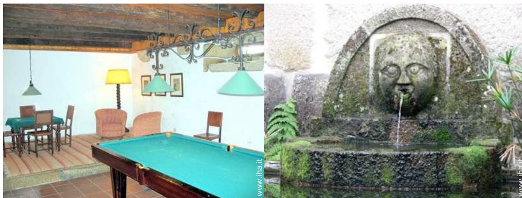
sala dei giochi