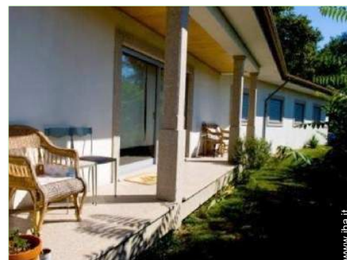
vista dalla veranda

Barbecue, tavolo da giardino, sedia(e) da giardino, ombrellone, chaise(s) longue(s), sedia sdraio, 1 amaca(che), rocking chair(s), altalena, struttura rampicante per bambini