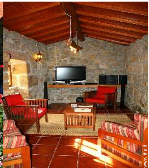
sala di musica