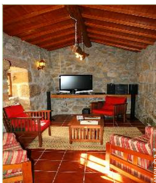
sala di musica