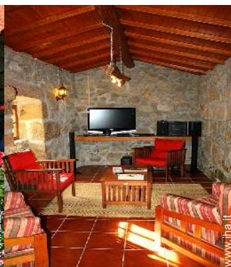
sala di musica