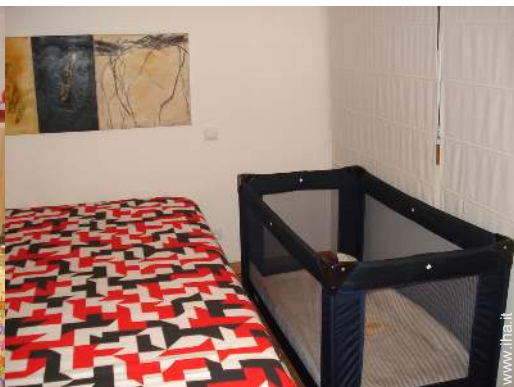
letto (i) bambino