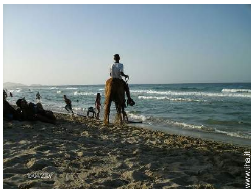
passaggiata a cavallo