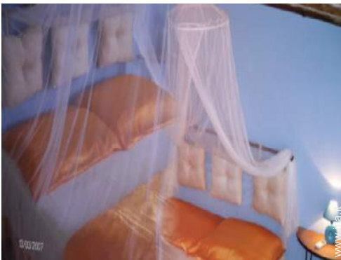
zanzariere per letto