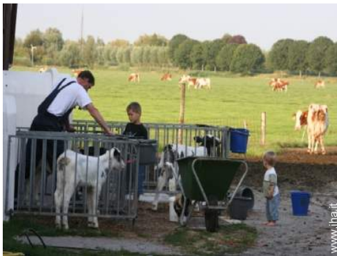
animali da fattoria