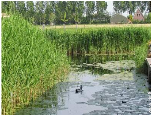
piscina fuori terra