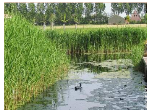
piscina fuori terra