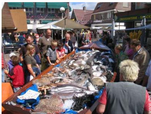
vista sul centro del paese