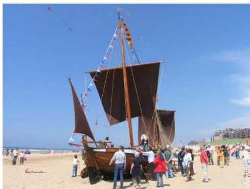
escursione in barca