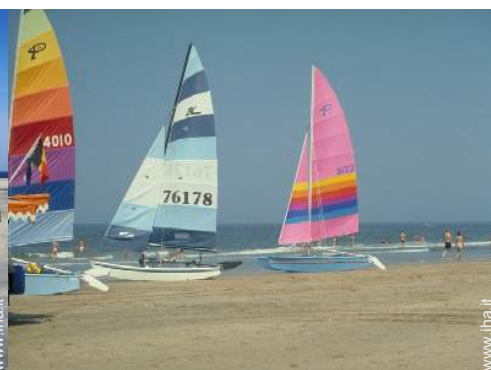
sport acquatici nelle vicinanze