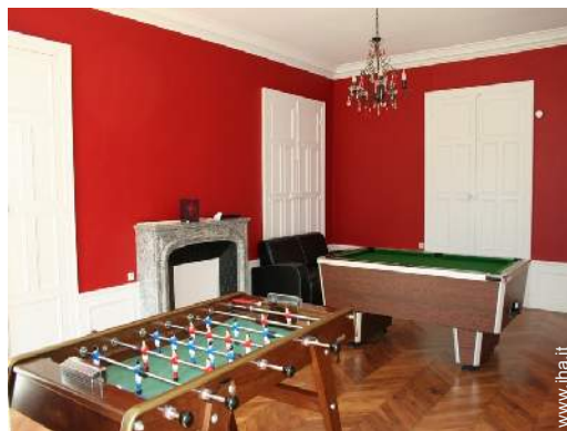
sala dei giochi