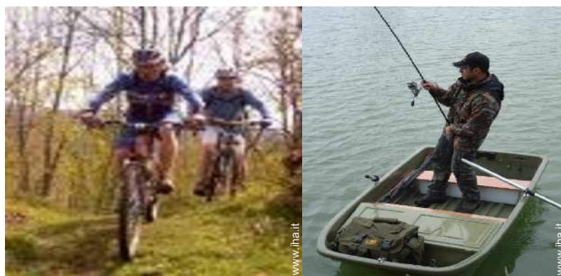
percorso per mountain bike