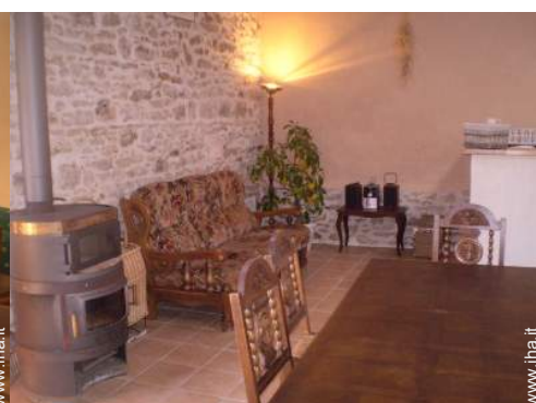
stufa a legna