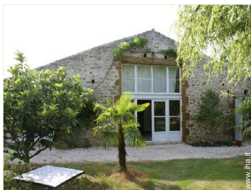
Antico Granaio di Charme