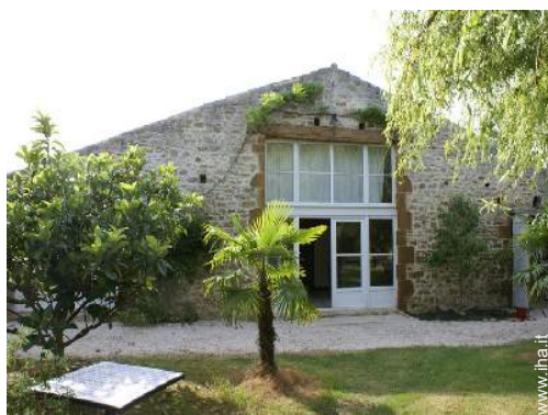
Antico Granaio di Charme