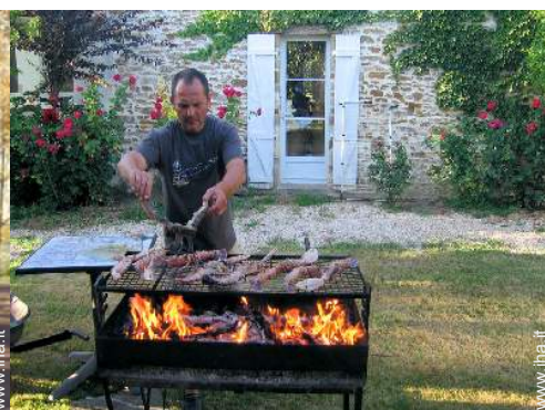
Il vostro ospite