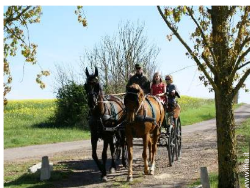
passeggiata in calesse