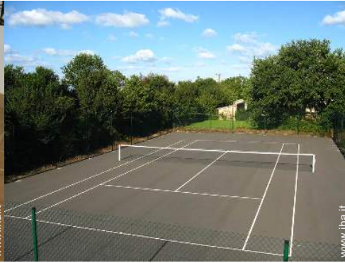
Tennis - superficie dura