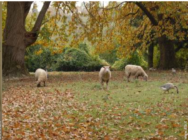
Gli animali domestici