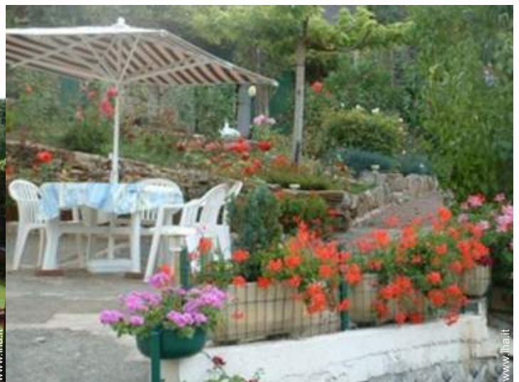
salotto da giardino