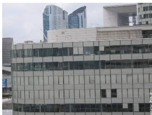
vista sul grattacielo