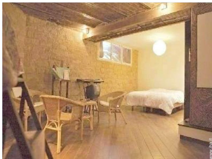
camera del proprietario