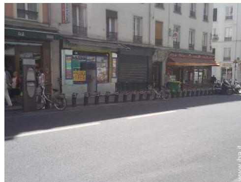
noleggio biciclette/mountain bike