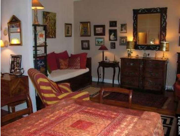
letto(i) a scomparsa 2 pers