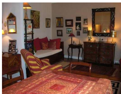
letto(i) a scomparsa 2 pers