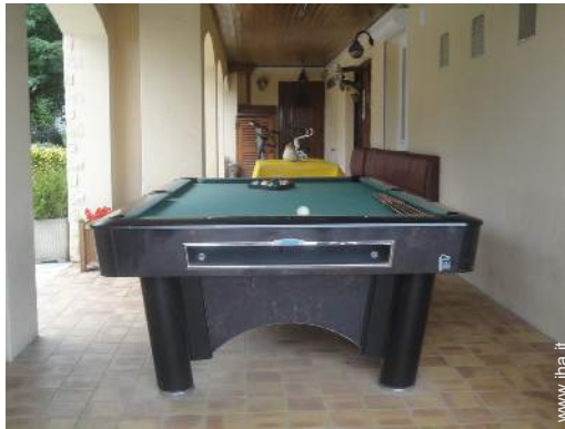
vista dal patio