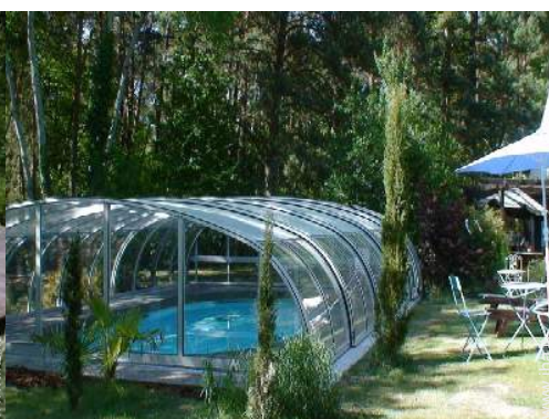
Attrezzature esterne a disposizione degli ospiti