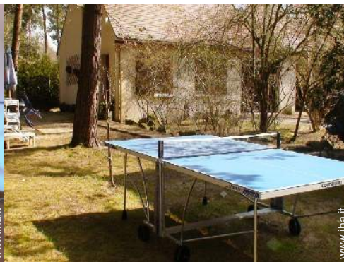
Installazione esterna a disposizione degli ospiti