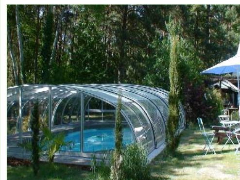
Attrezzature esterne a disposizione degli ospiti