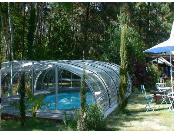
Attrezzature esterne a disposizione degli ospiti