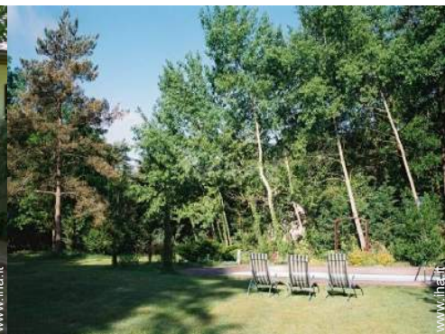
parco e giardino