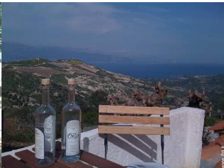
vista dalla terrazza sul tetto