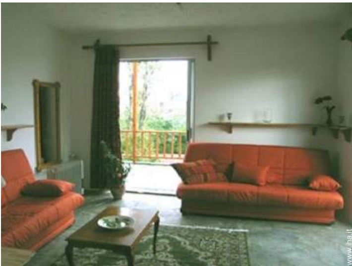
Comfort interno a disposizione degli ospiti