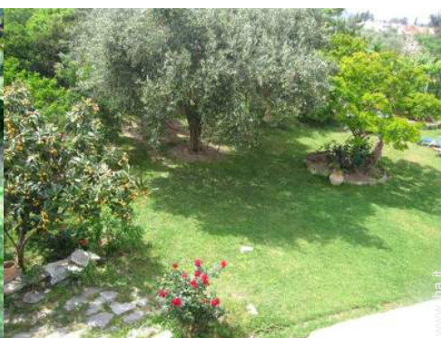
Installazione esterna a disposizione degli ospiti