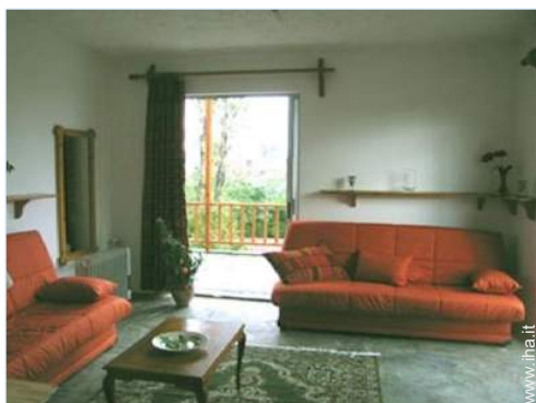
Comfort interno a disposizione degli ospiti