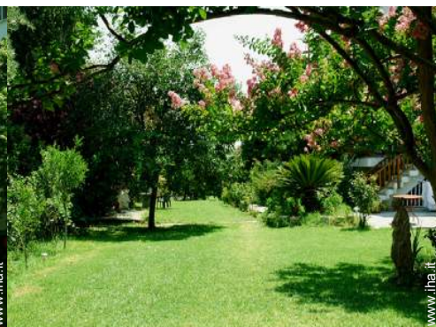
Installazione esterna a disposizione degli ospiti