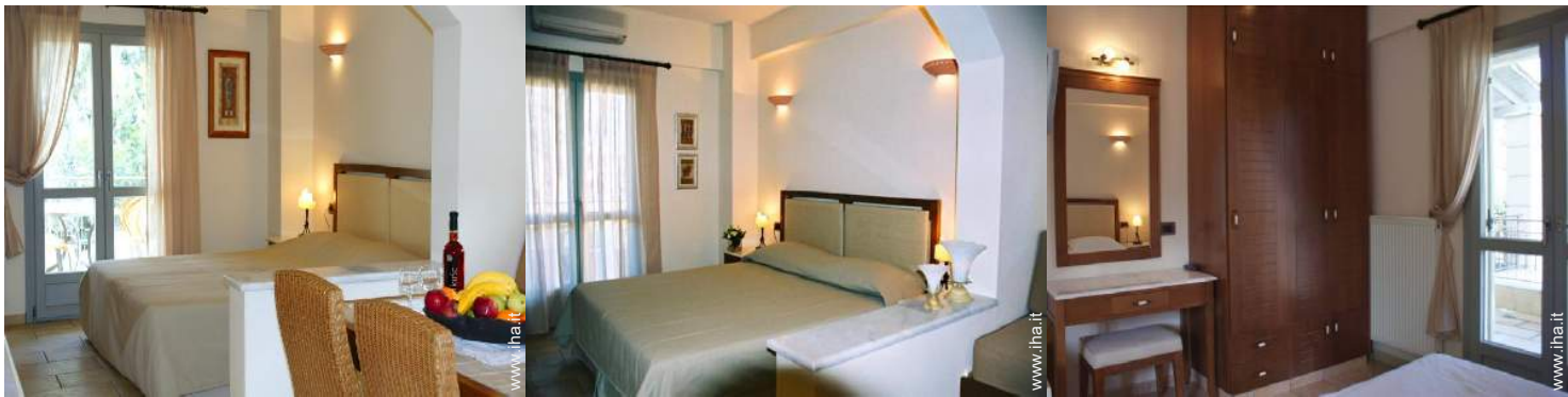
Maisonnette di Charme