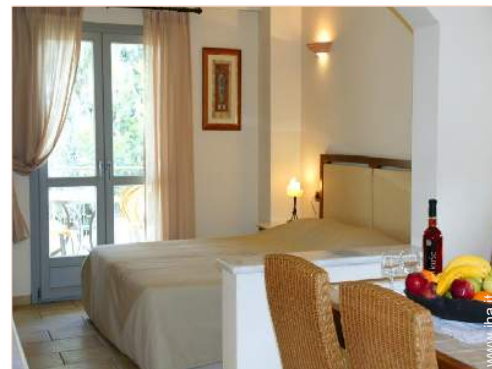
Maisonnette di Charme