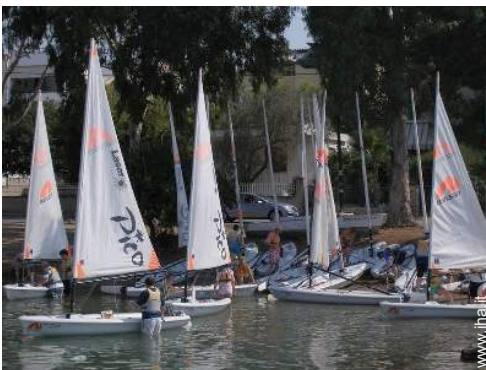
scuola di vela