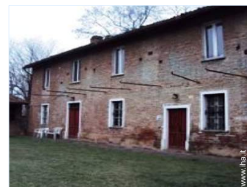
Casa di Campagna