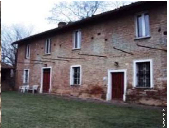
Casa di Campagna