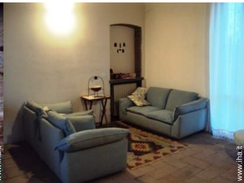
Casa di Campagna