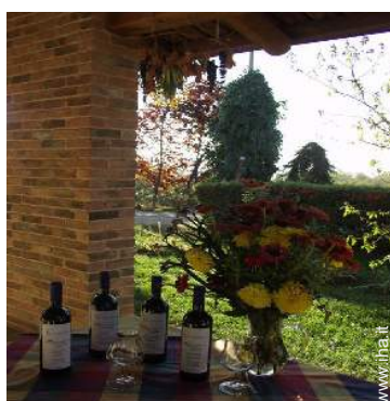
cantina e degustazione di vino