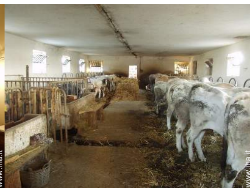
animali da fattoria