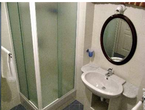
stanza di servizio