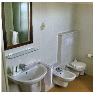
stanza di servizio