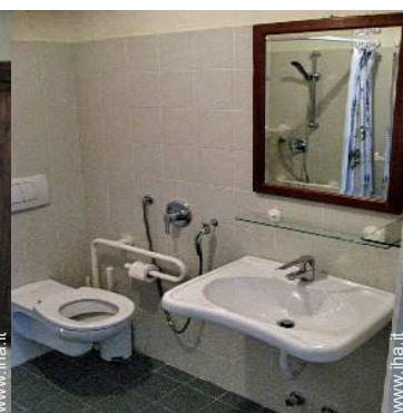
stanza di servizio