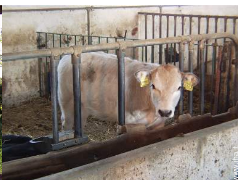
animali da fattoria