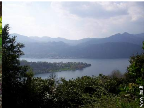
vista sul lago