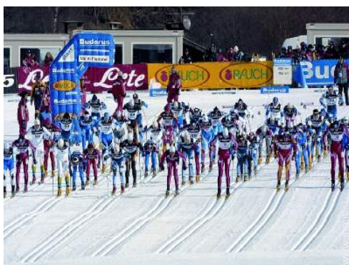
sport invernali nelle vicinanze