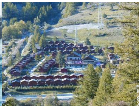
vista sul villaggio