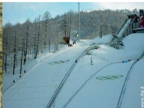
sport invernali nelle vicinanze