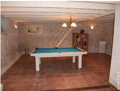
tavolo da biliardo