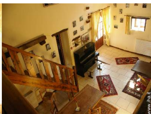
vista dalla loggia