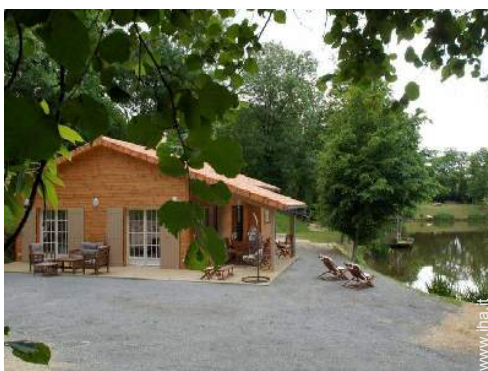
Casa in Legno di Charme