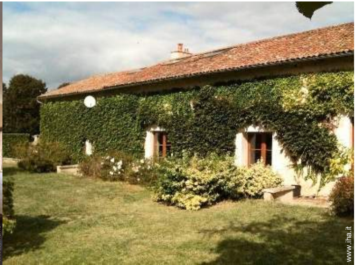
Casa Tipica di Charme