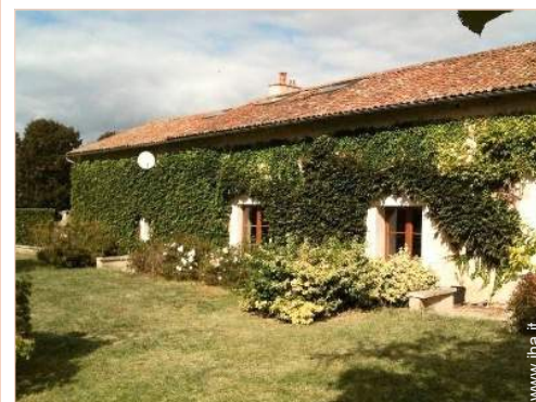
Casa Tipica di Charme