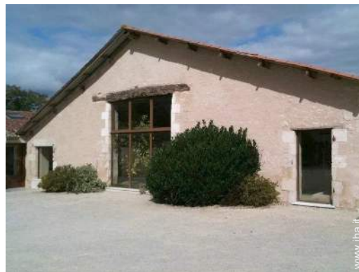
Casa Tipica di Charme