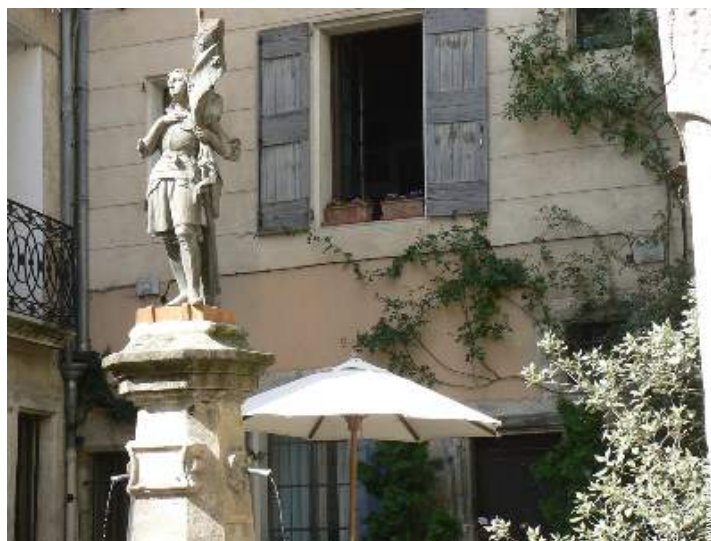
Casa in Pietra di Charme