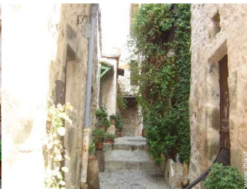
vista sul centro del paese