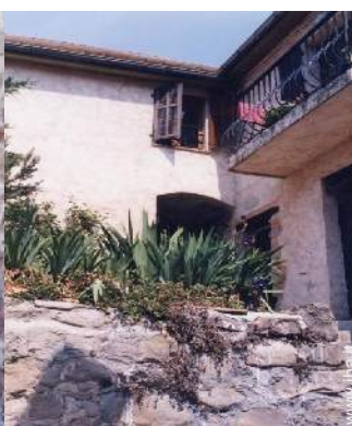
Casa di Villaggio