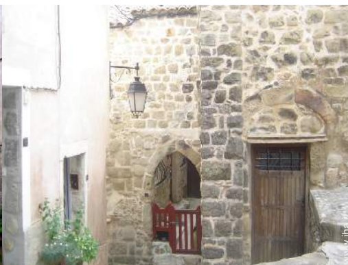
vista sul centro del paese