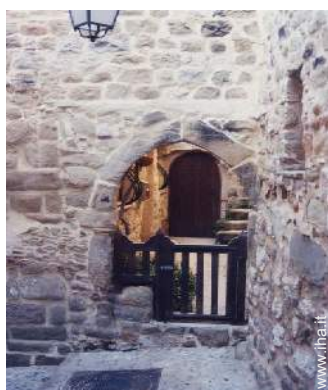
Casa di Villaggio