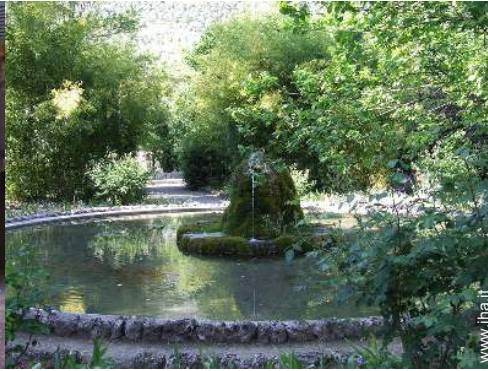
parco e giardino