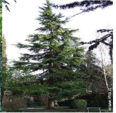
parco e giardino