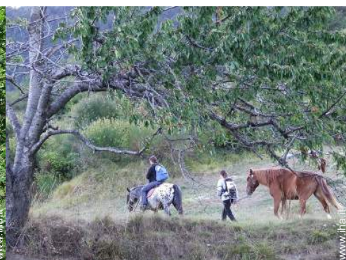
passaggiata a cavallo