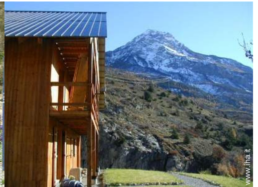
vista sulla montagna