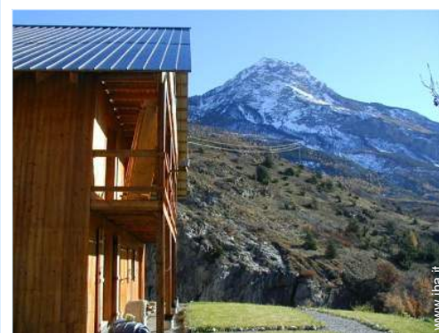
vista sulla montagna

- Asilo 1,5km - Villaggio centro 1,5km - Centro città 1,5km - Fermata/stazionamento bus 500m - Bus navetta piste di sci 500m - Noleggio biciclette/mountain bike 1,5km - Noleggio attrezzatura di sci 1,5km - Panetteria 1,5km - Traiteur 1,5km - Negozi tipici 1,5km - Supermercato 1,5km - Salone di coiffure 1,5km - Ufficio postale 1,5km - Banca 1,5km - Distributore automatico di biglietti 1,5km - Farmacia 1,5km - Medico 1,5km - Infermiera 1,5km - Ospedale 15km