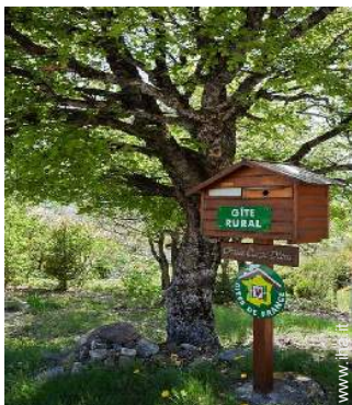
Chalet di Montagna di Charme