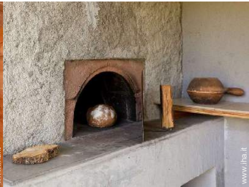
forno per pizze