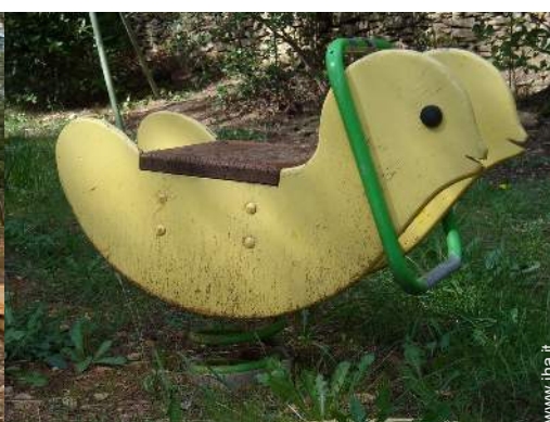
struttura rampicante per bambini