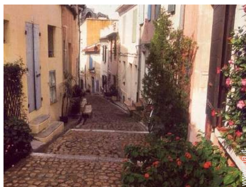
Casa di Città