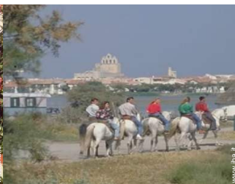
sport estivi nelle vicinanze