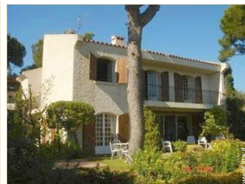
Casa Provenzale di Lusso