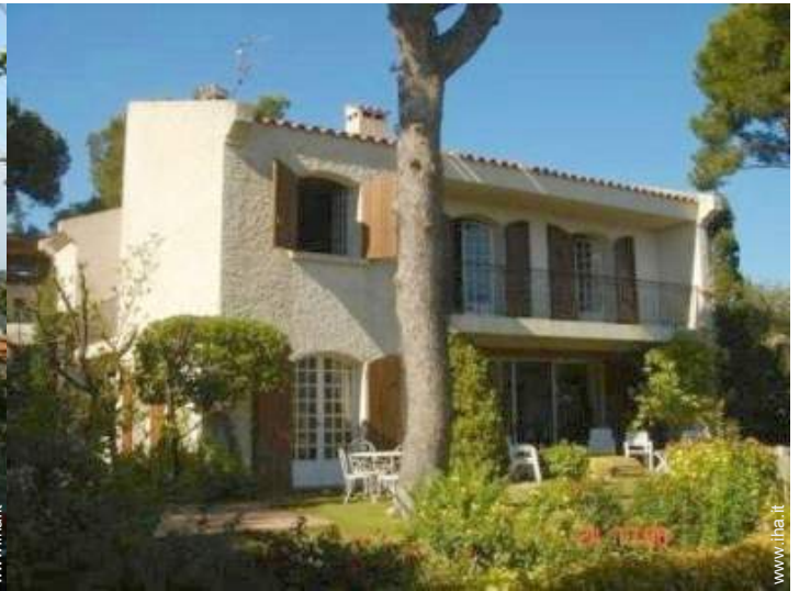
Casa Provenzale di Lusso