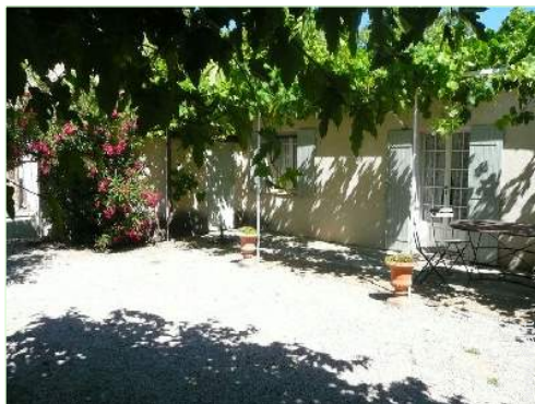
Ambito esterno a disposizione degli ospiti