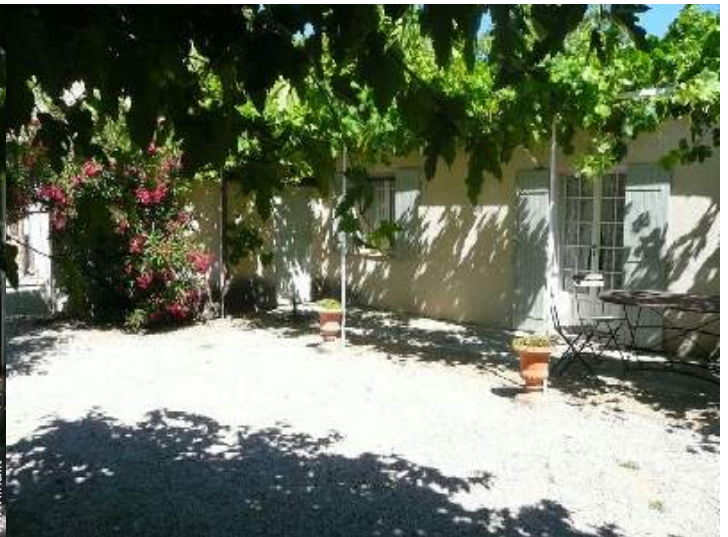
Ambito esterno a disposizione degli ospiti