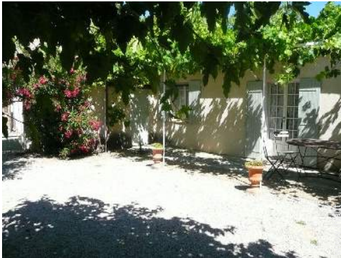
Ambito esterno a disposizione degli ospiti