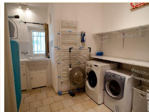
sala dei giochi

Salotto estivo, barbecue, barbecue a gas, tavolo da giardino, 20 sedia(e) da giardino, pergolato, ombrellone, salotto da giardino, 15 chaise(s) longue(s), 15 sedia sdraio, doccia esterna, WC esterno