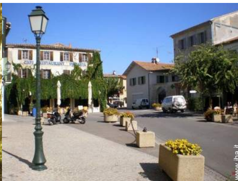
vista sul centro del paese